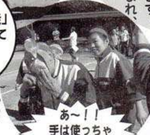
あ~!! 手は使っちゃだめですよ!