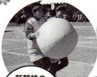
新競技の「デカパン競走」会場を沸かしてくれました。

十年に一度といわれた大型の台風が過ぎ去り、快晴の秋空の下、秋季大運動会が行なわれました。今日の為に多くの練習を積んできた利用者さんの闘志は職員を毎年驚かせてくれます。高瀬・中高瀬保育園の園児達のボールやフラッグでのアトラクションは場を和ませ、皆を自然と笑顔にさせます。会場は大きな拍手で包まれ、秋の楽しいイベントとなりました。