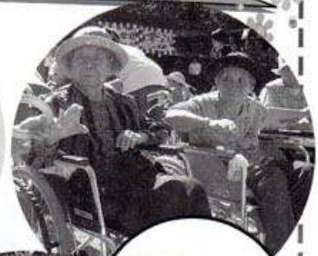
「玉入れ」や「輸送り」は今年も大盛り上がり!