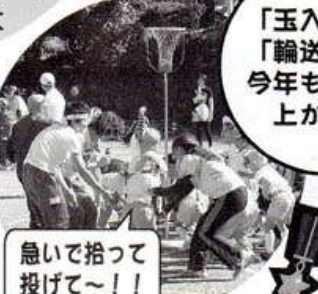
急いで拾って投げて~!!