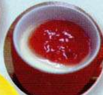
ヨーグルトパバロア