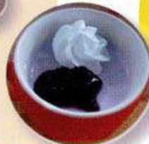
パバロア風ゼリー