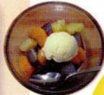
クリームあんみつ