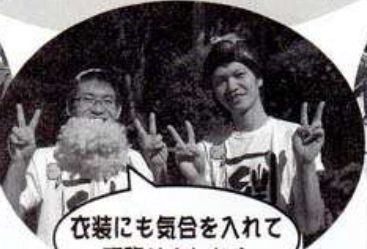
衣装にも気合を入れて頑張りました!