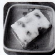
フルーツ牛乳寒天

苑ではおやつに栄養価の高い牛乳を提供しています。アレルギー以外の理由で牛乳が苦手な方にも、寒天で固めたり、□当たりの良いプリンにしたりと、食べやすく工夫して提供しています。